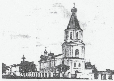
Воскресенский войсковой собор (ГОИЛ музей).

лжица и две тарелочки; весом весь прибор 3 ф. 79 зол. и 3. одно копие стальное с черенком из сандалового дерева". Кроме перечисленных предметов Екатериной II было подарено множество других церковных вещей. "Опись, учиненная церковной утвари Омского Воскресенского собора" от 16 ноября 1796 года, хранящаяся в Тобольском филиале Государственного архива Тюменской области, содержит информацию о всем церковном имуществе. Из даров "от двора ея императорского величества" указаны также "одежда парчи на золоте по малиновой земле с разными шелковыми травами...", одежды на жертвенниках и престолах и другие (Продолжение на с. 7)