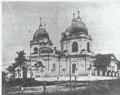
Ильинская церковь (ГОИЛ музей).

Но доводы комиссии не убедили руководство горсовета, и здание передали военным. Вскоре оно пришло в запустение, и в конце 1950-х годов его разобрали.